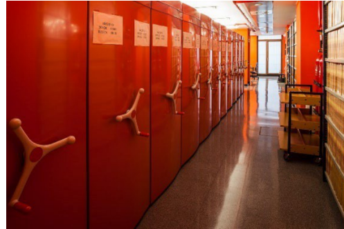
Imagen 2. Uno de los tres depósitos del archivo