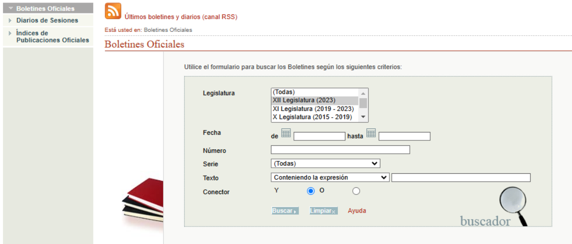
Imagen 6. Página de Buscadores de Boletines y Diarios de sesiones