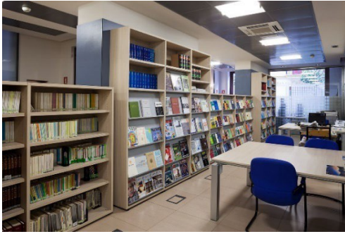
Imagen 1. Sala de lectura del edificio administrativo