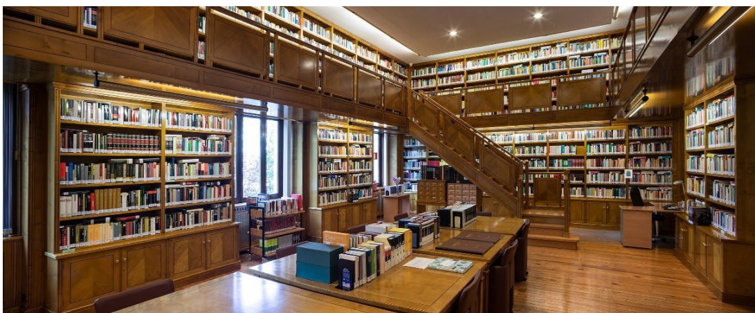
Imagen 3. Sala de lectura del Palacio

Se ofrece atención personalizada de lunes a viernes entre 12 y 14 horas . Previa aviso puede acceder a la sala de consulta en cualquier momento. Podrá contactar con el personal del Servicio por correo electrónico ( biblioteca@jgpa.es ) o por teléfono.